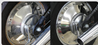
定期点検時の洗車サービス※1